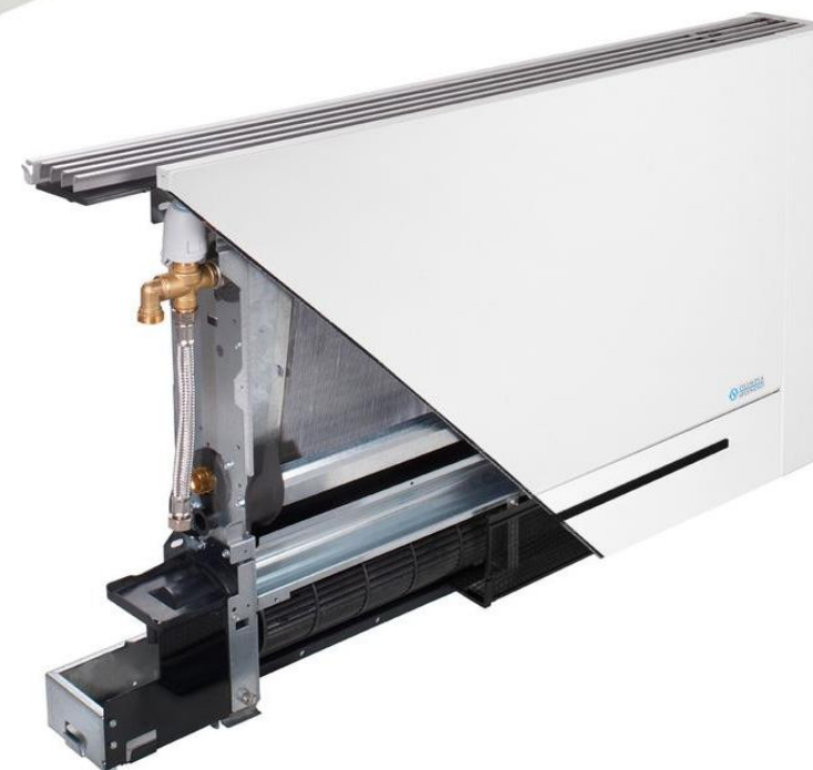
SL 4 тръби