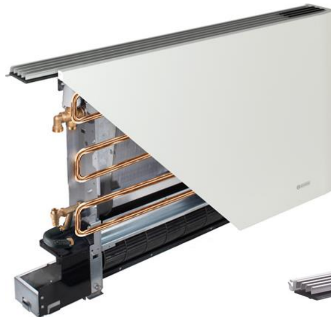
SLR 4 тръби