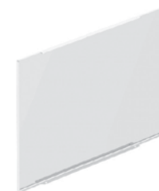
B0171 - B0653